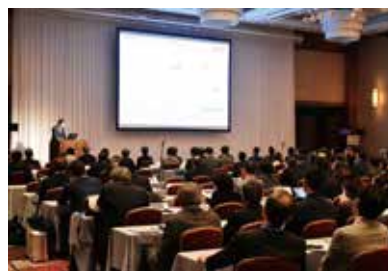
アジア物流フォーラムの様子

舶の燃料油中の硫黄分濃度を現行の3.5%以下から0.5%以下とする環境規制強化が大きな課題となるとし、いずれの対策でも船社にとってコスト増が不可避な中、どのように乗り切るかが鍵となると指摘した。