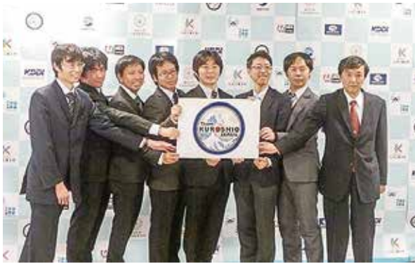
図2 Round1進出合同記者会見

一関門である「技術提案書審査」を突破、今年10月に開催されるRound1へと進出する21チームに選ばれました。なお、日本からの参加3チームの中では、唯一のRound1進出チームです。このRound1突破に向け、我々は「複数のAUVを駆使して海底地形調査を行う」という戦略を立てており、現在要素技術の試験および機器の開発等に鋭意取り組んでいます。