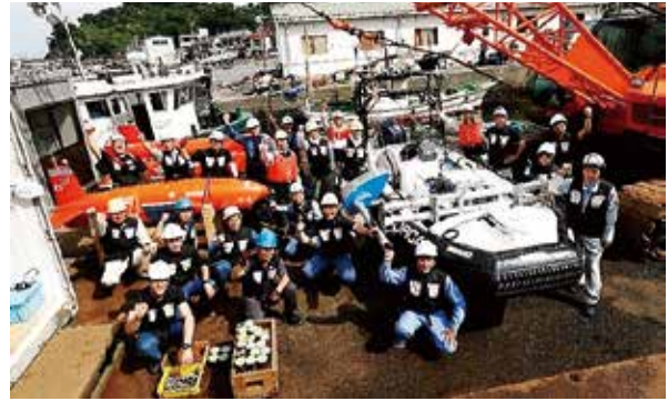
図3 今年5月に実施した海域試験でのTeam KUROSHIO

このチームは、まだ何も成し遂げていない若輩者ばかりですが、どんな海よりも深い熱意を持ったメンバーが集結しています。この度のShell Ocean Discovery XPRIZEに対し、我々は「日本代表」である意気込みでメンバー丸となって挑む所存です。なお、チームの活動状況等については、SNS（Twitter/Facebook）にて逐次発信してまいります。