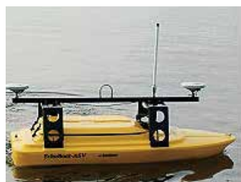
図1 Echo Boat

東陽テクニカではこうした無人水上艇をはじめとした各種観測用ビークルと、これまでに培ってきた豊富な観測機器のノウハウを組み合わせ、新しい海洋調査の時代を拓くお手伝いをしたいと願っています。