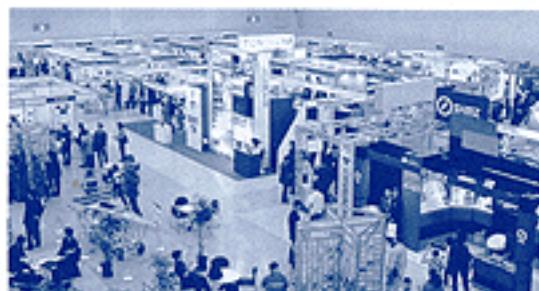
テクノオーシャン2000の会場