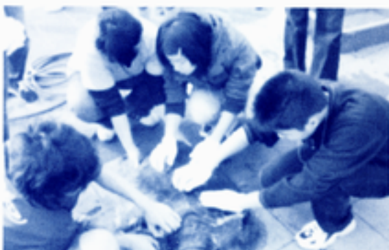
甲羅の清掃を手伝う参加者