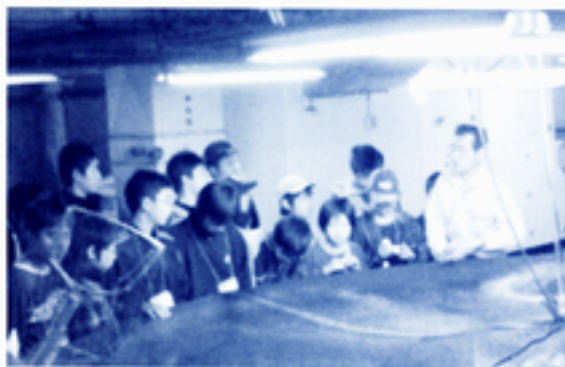
水族園の飼育・管理施設の説明を受ける参加者