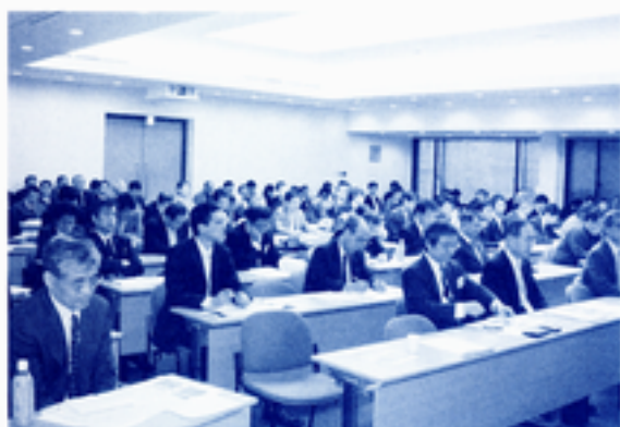
講演会の会場の様子

深海底の探査は、資源開発だけでなく防災や海洋環境にとっても重要であることを紹介されました。