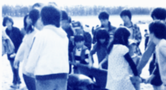
新しいウミガメを抱えて遊ぶ参加者

測定や甲羅の清掃などを行った。素手でウミガメに直接に触れる体験を通して、地球に住んでいるのは人間だけでなく、多くの生物に支えられている事実を再認識していた。