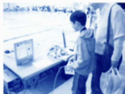
ROV体験操作を楽しむ様子